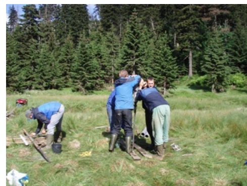
Wiercenia w osadach dawnych jezior w Karkonoszach

Zakład Geomorfologii pl. Uniwersytecki 1 50-137 Wrocław tel. 71 3752 295